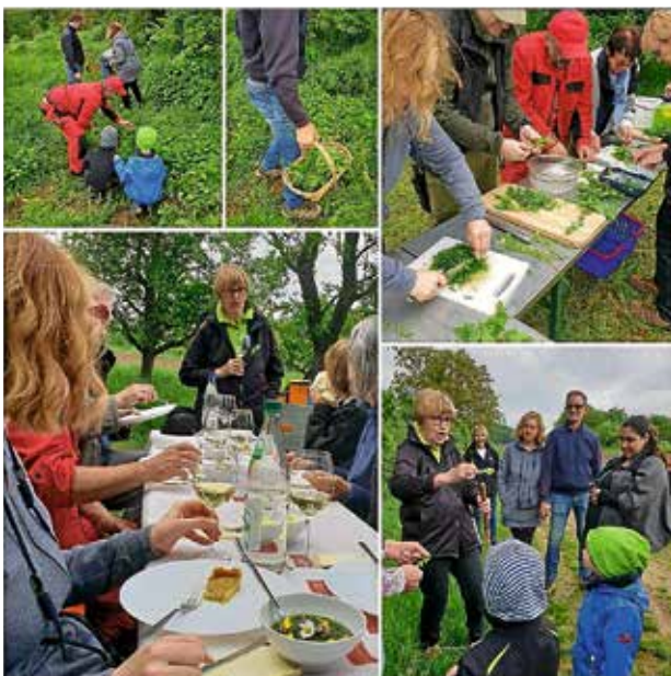
Letzte OGV Kräuterwanderung 2023

Am Sonntag, 5. Mai heißt es um 14.00 Uhr endlich wieder Kräuterwanderung mit dem OGV und Familie Schopper. Nach erfolgreicher Kräutersuche mit kleiner Kräuterkunde, werden wir unsere gesammelten Schätze in gemütlicher Runde verarbeiten und natürlich auch probieren. Lassen sie sich überraschen!