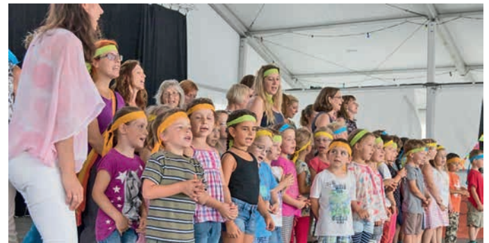
Die Kindergärten aus allen Ortsteilen trugen ebenfalls zum bunten Nachmittag mit ihren fröhlichen Liedbeiträgen bei.