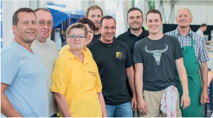
Die fleißigen Helfer der örtlichen Vereine bewirteten unsere Festbesucher an allen vier Tagen mit leckeren Speisen und kühlen Getränken.