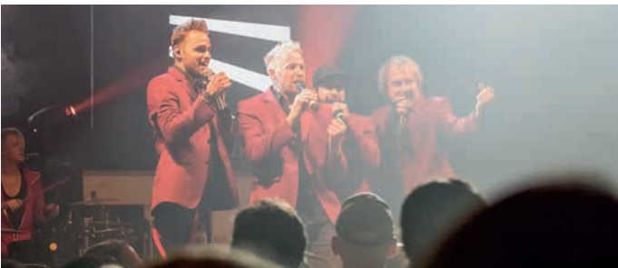
Als Auftaktveranstaltung unterhielt und begeisterte Barbed Wire am Abend unsere Festbesucher mit einer abwechslungsreichen und spektakulären Show.