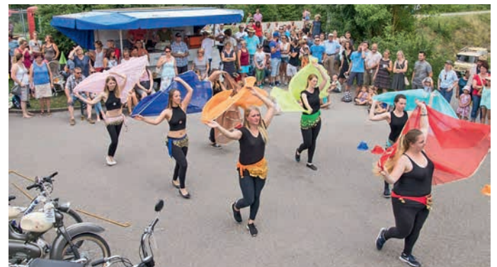
Tanzbeitrag der Bauchtänzerinnen aus Michelbach