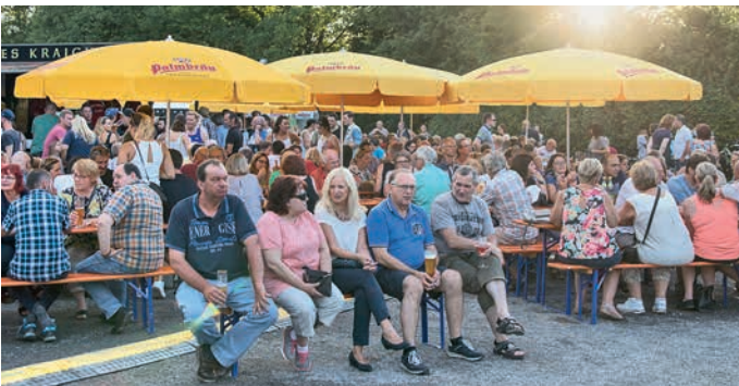
Auch unser Vergnügungspark erfreute sich an allen vier Tagen an zahlreichen Besuchern.