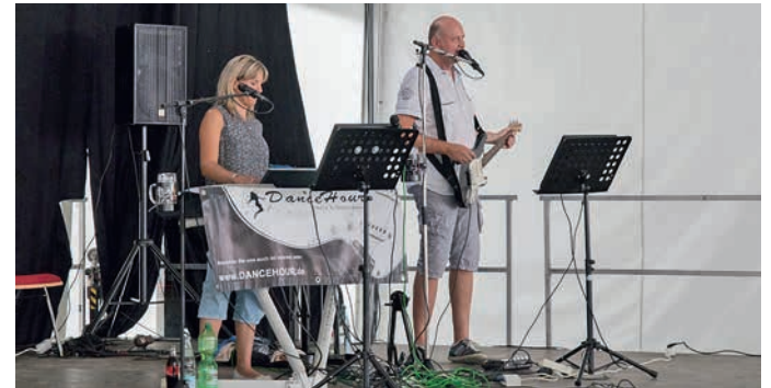
Unsere Senioren und Festbesucher erfreuten sich an der unterhaltsamen Musik der Tanzband DanceHour.