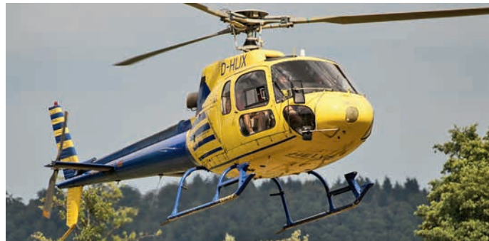
Die Gelegenheit, mit dem Hubschrauber einen Rundflug über Zaberfeld und Umgebung zu machen, nutzten beim diesjährigen Seefest viele Besucher.