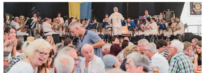
Der Musikverein „Spielmannszug“ Zaberfeld umrahmte den Fassanstich.