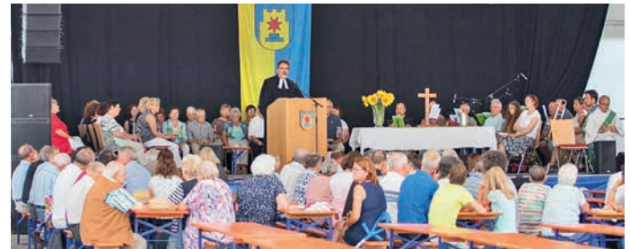
Der Sonntag wurde mit einem ökumenischen Gottesdienst im Festzelt begonnen.