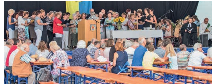
Die Kirchenchöre aus Leonbronn und Zaberfeld, der Gesangverein „Eintracht“ Zaberfeld sowie der Posaunenchor Michelbach unterhielten die Gottesdienstbesucher.