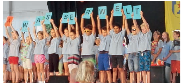
Der Chor der Grundschule Zaberfeld eröffnete mit Liedbeiträgen den zweiten Festtag.