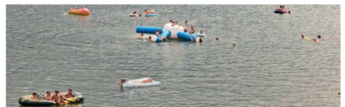
Wasserspiele auf der Ehmetzlinge mit der DLRG