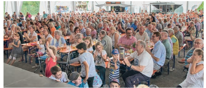
Der Montag begann mit dem traditionellen Mittagstisch, dem der gemeinsame Seniorennachmittag folgte.