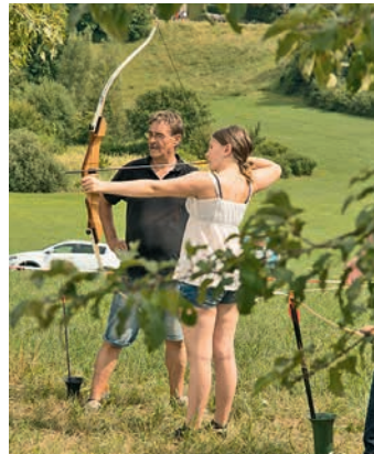
Auch die Modenschau mit Ellens Mode und das Bogenschießen mit dem TSV Ochsenburg kamen bei den Besuchern sehr gut an.