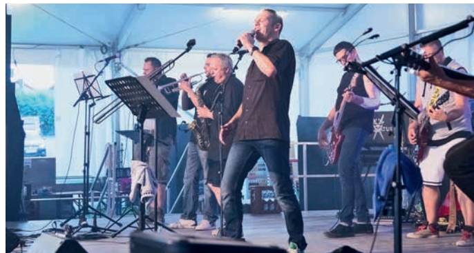
Zum Abschluss des dritten Festtages rockte die Oxuvatus Big Band am Abend.