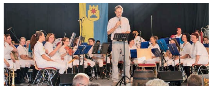
Bürgermeister Csaszar begrüßte die Seefestbesucher und eröffnete mit offiziellem Fassanstich das Seefest.