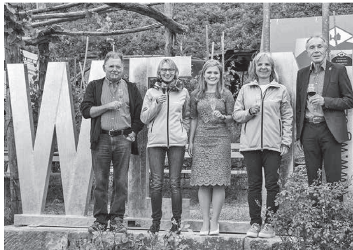
Offizielle Einweihung der WEIN-Fotospots am Weinausschank im Zweifelberg

Weitere Infos zu den WEIN-Fotospots, den aktuellen und geplanten Standorten sowie dem Foto-Upload in die Bildergalerie finden Sie unter www.wein-fotospot.de .