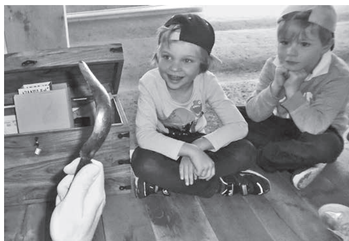
Instrument zur Haarentfernung

Frühstück spielten wir römische Spiele ohne Strom. Dazu brauchte man keine Fernseher, Tablets oder sonstiges. Wir spielten Würfelspiele und das römische Rundmühlen-Spiel in Form eines Brettspiels. Dieses können wir nun auch in der Kita spielen.