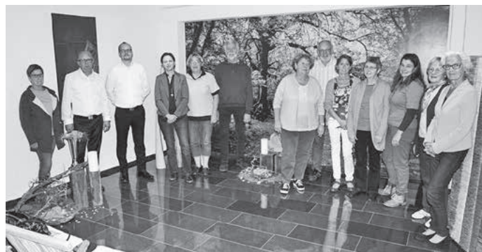
rob/Foto: Roland Baumann

Ein „Raum der Stille“ bietet gleich neben dem Eingangsbereich die Möglichkeit, sich in kleinerem Kreis von den Verstorbenen zu verabschieden.