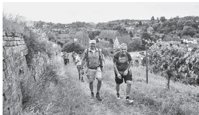
Vorbei am UNESCO-Weltkulturerbe Kloster Maulbronn

Vierhundert Teilnehmer waren bei ersten Eppinger-Linien-Wandermarathon 2017 dabei. Für die Teilnehmer des Wandermarathons wird ein umfassender Service geboten, von der Vollverpflegung über ein umfangreiches Starterpaket bis hin zum Busshuttle.