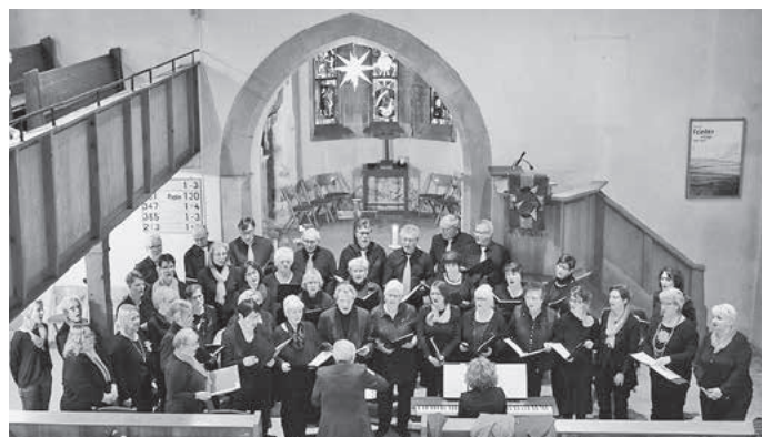
Frauenchor Zaberfeld und GetUp beim Kirchenkonzert

Besuchen Sie auch www.eintracht-zaberfeld.de .