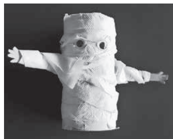
Eine von Schülern erstellte „Mumie“ im Rahmen des Themas „Ägypten“

Auch in diesem Jahr zeigten Schüler, Lehrer, Eltern und auch für viele Ehemalige erneut großes Interesse beim Tag der offenen Türe der Realschule Göglingen am Samstag, 08.02.2020. Die Realschule öffnete um 9.30 Uhr ihre Türen für die Öffentlichkeit und startete mit einer Begrüßung und kleinen Vorführungen. Dieses Jahr bot die Realschule insbesondere für interessierte Viertklässler der Grundschulen unserer Region und deren Eltern die Möglichkeit, bei geführten Rundgängen oder nach eigenem Besucherinteresse bei offenen Türen Unterricht mitzuerleben und die Besonderheiten bestimmter Fächer zu sehen.