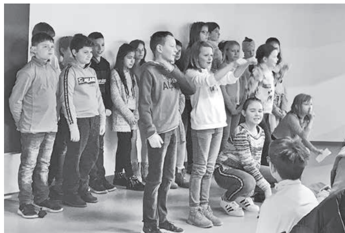
Schülergruppe Klasse 5 bei einer Vorführung

Repräsentanten der Schule informierten über Möglichkeiten der Ganztagesbetreuung. Dass Digitalisierung an der Realschule Göglingen vernünftig praktiziert wird und dort, wo es sinnvoll ist, selbstverständlich auch mit Computern, Tablets, Smartboards oder mit einem 3D-Drucker gearbeitet wird, war in verschiedenen Räumen zu sehen. Ein kulinarisch attraktives Angebot des Elternbeirats rundete den sehr gut besuchten Tag der offenen Türe ab. (EH)